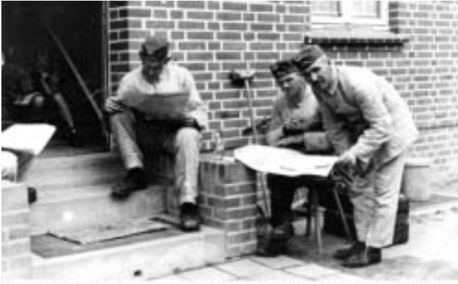
Soldaten vor dem Eingang zur Hausmeisterwohnung des HJ-Heims im April 1945

nahm er trotzdem mit, ihren Ehering konnte meine Mutter