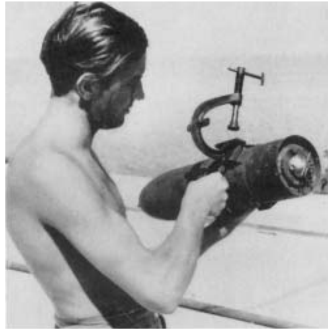
„Hai“ mit Schraubzwinge