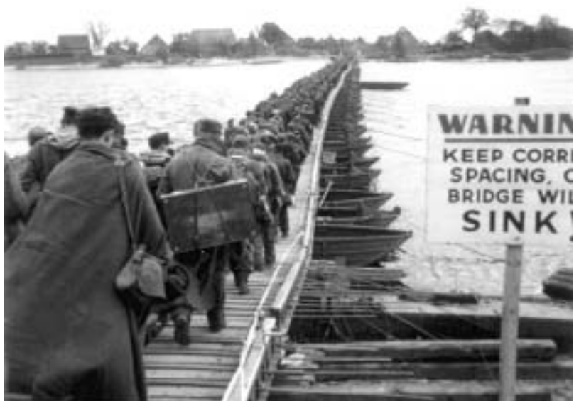
Deutsche Gefangene queren die Elbe nach Hohnstorf

Das I. Bataillon war im Raum Hellberg von mehreren Wellen englischer Infanterie, unterstützt von 10 Panzern, wiederholt angegriffen worden. Es war der meisterhaften Abwehr des I. Bataillons jedoch immer wieder gelungen, diese Angriffe abzuweisen. Um 20.00 Uhr hatte der Engländer