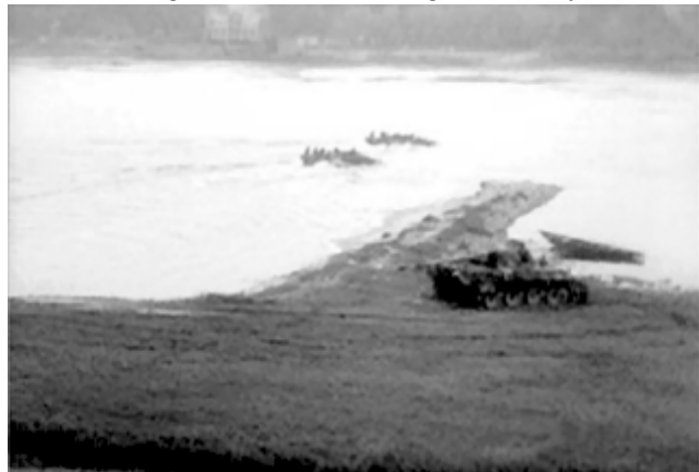
Der gesprengte Panther auf den Artlenburger Auwiesen, im Hintergrund der brennende "Sandkrug"

Über das Geschehen in Artlenburg gibt die dortige Dorfchronik Auskunft: „Das Kriegsgeschehen näherte sich jetzt immer mehr der Elbe. Vielfach vergruben die Leute Wertsachen und Wäsche. (...) Ein Zug des Artlenburger Volkssturms musste die Neetzebrücke in Lüdershausen bewachen. Von Lüneburg zogen von nun an Truppenverbände der Elbe zu (...) Die alte Heerstraße bot ein buntbewegtes, z.T. auch trauriges Bild. Infanteristen,