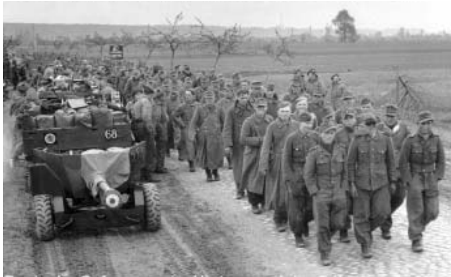
Deutsche Gefangene, im Hintergrund die Artlenburger Mühle

Um die vielen Verwundeten der Kampfhandlungen behandeln zu können, wurde das Reserve-Lazarett Deutsche Zündholz Fabrik, Reeperbahn, die (Not-) Lazarette Grund-