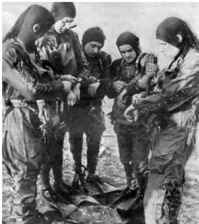
Kampfschwimmer beim Uhrenvergleich