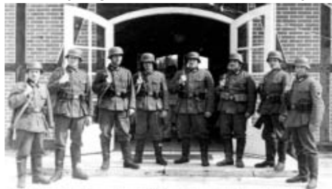
Deutsche Soldaten im April 1945 vor dem HJ-Heim in Lauenburg Interessant das Alter der Soldaten und das Fehlen von Kampfauszeichnungen

Baubataillon. Im Bornholz bei Gülzow (...) stand eine Flakbatterie. In Lüttau (...) lag das SS-Grenadier Ersatz- und Ausbildungsataillon 18 aus Hamburg - Langenhorn in Reserve.“