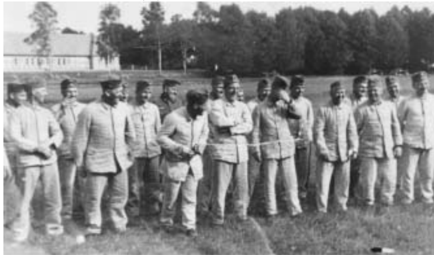
Gutgelaunte deutsche Soldaten im April 1945 angetreten, im Hintergrund das Lauenburger HJ-Heim

Als Angehöriger der Lübeckischen 30. Infanterie-Division, welche immer noch mit ungebrochenem Kampfgeist im Kurland-Abschnitt sich der angreifenden russischen Übermacht erwehren konnte, wurde ich Mitte April 1945 mit einem der vorletzten Seetransporter zu einem Lehrgang in die Heimat kommandiert. (...)