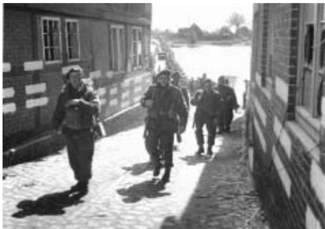
Britische Soldaten in Mahnecke's Twiete, im Hintergrund die Pontonbrücke und der Fischerzug