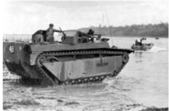
Buffalo-Schwimmpanzer beim Übergang nach Lauenburg

In Artlenburg setzte die 15. Schottische Division über und von Hohnstorf aus die 1. „Commando-Brigade“, ein Eliteverband der Royal-Marines. Hinter der 15. Division sollte die 11. Panzer-Division und hinter den „Commando-Men“ die 5. Infanterie-Division folgen.